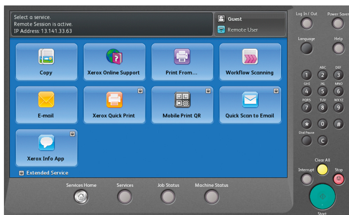
Interface utilisateur présentant toutes les applications Xerox® ConnectKey.