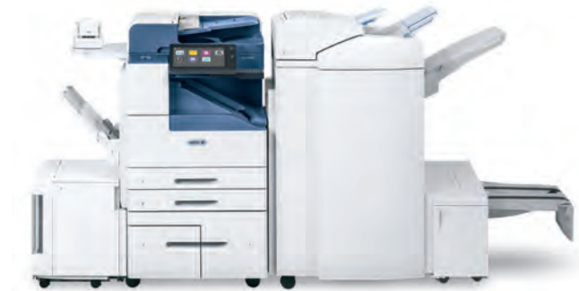
Xerox® AltaLink® B8045/B8055/B8065/B8075/B8090 Multifunktionsdrucker