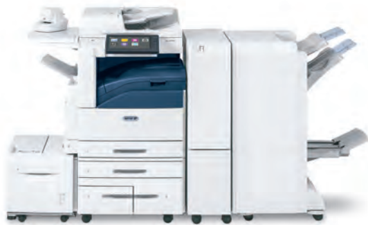
Farb-Multifunktionsdrucker Xerox® AltaLink® C8030/C8035/ C8045/C8055/C8070