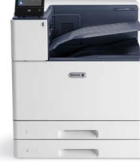
Xerox® VersaLink® C9000 -väritulostin