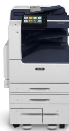
Xerox® VersaLink® C7120/C7125/C7130 -värimonitoimitulostin