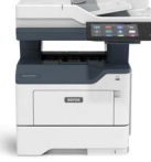
Xerox® VersaLink® B415- monitoimitulostin