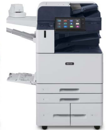
Xerox® AltaLink® B8145/B8155/ B8170 -monitoimitulostin

* Tuote ei ole saatavana kaikilla maantieteellisillä alueilla, ota yhteyttä myyntiedustajaan.