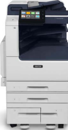
Xerox® VersaLink® B7125/B7130/ B7135 -monitoimitulostin