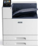
Xerox® VersaLink® C8000 -väritulostin