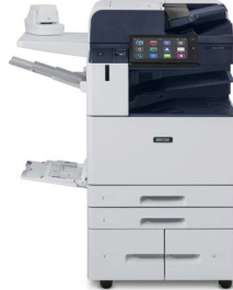
Xerox® AltaLink® C8130/C8135/C8145/ C8155/C8170 -värimonitoimitulostin