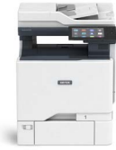
Xerox® VersaLink® C625- värimonitoimitulostin*