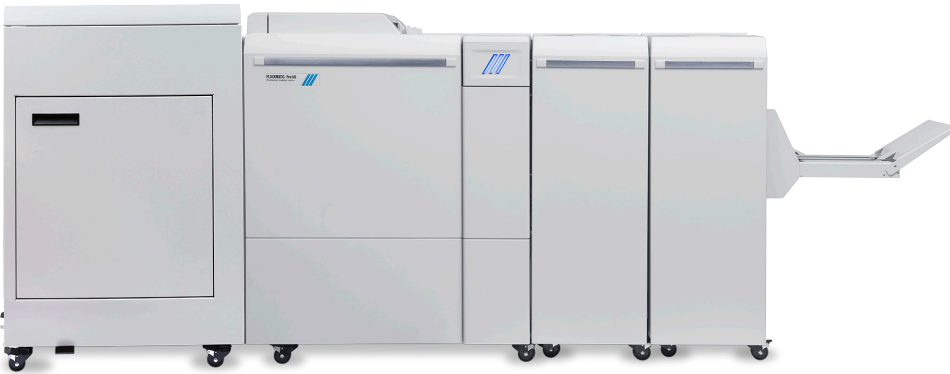
Realizador de folletos Plockmatic Pro50/35, fabricado por Plockmatic International AB

Crea folletos de calidad profesional a velocidad nominal, con una solución en línea compacta y asequible.