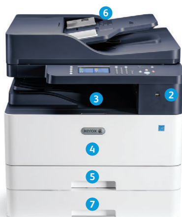
Imprimante multifonctions Xerox® B1025 Configuration avec chargeur automatique de documents recto verso et magasin supplémentaire en option