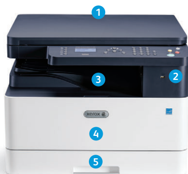
Imprimante multifonctions Xerox® B1022

9 La Xerox® B1025 est dotée d'un écran tactile couleur de 4,3 po pour plus de simplicité.