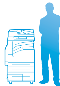
WorkCentre 5335 med högkapacitetstandemmagasin