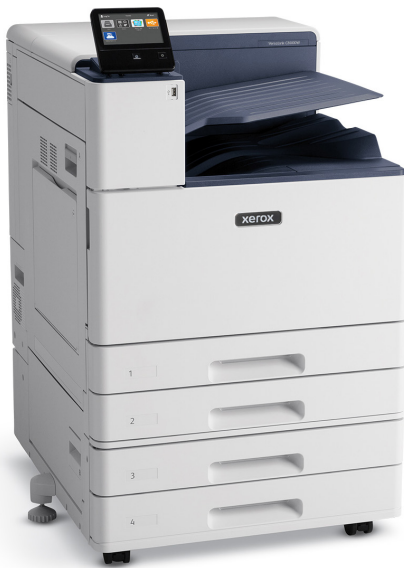
VersaLink® C8000W plus module met 2 laden