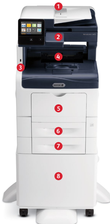
Kolorowe drukarki wielofunkcyjne Xerox® VersaLink® C405 Druk. Kopiowanie. Skanowanie. Faks. E-mail.