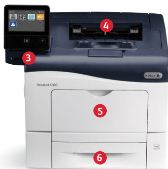
Drukarka kolorowa Xerox® VersaLink® C400 Druk.