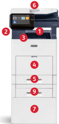
Xerox® VersaLink® B615-multifunktionsprinter Udskriv. Kopier. Scan. Fax. E-mail.