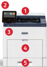
Xerox® VersaLink® B610-printer Udskriv.