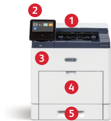
Принтер Xerox® VersaLink® B600 Печать.