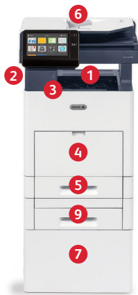
Многофункциональное устройство Xerox® VersaLink® B605 Печать. Копирование. Сканирование. Факс. Электронная почта.