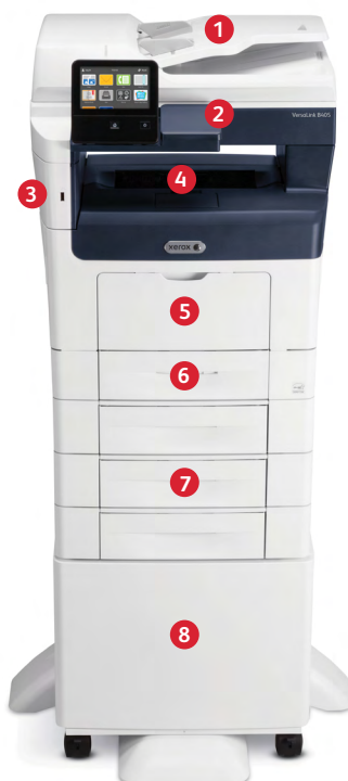
Xerox® VersaLink® B405 multifunktionsskrivare Skriv ut. Kopiera. Skanna. Faxa. Skicka e-post.