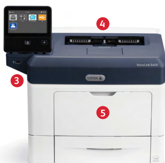
Xerox® VersaLink® B400 skrivare Skriv ut.

6 Med 550-arks pappersmagasin, är den totala standardpapperskapaciteten 700 ark (inklusive manuellt magasin).