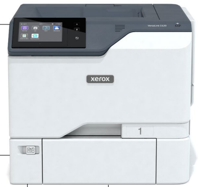
XEROX VERSALINK C620

מגש העקיפה ל-100 גיליונות מטפל בחומרי הדפסה בגדלים של 3 x 5 אינץ' עד 8.5 x 14 אינץ' 127/ 76.2 x 356 מ"מ עד 216 מ"מ.