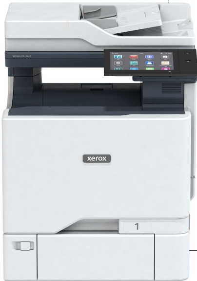
XEROX VERSALINK C625

מזין מסמכים אוטומטי דו-צדדי במעבר יחיד (DADF) חוסך זמן על ידי סריקה בו-זמנית של שני הצדדים של מסמכים דו-צדדיים עם עד 104/98 עמודים לדקה Letter/A4 תמונות בדקה ל-C625. קיבולת הנייר של 100 גיליונות מניעה את הפרודוקטיביות, בעיקר במשימות הדורשות אצווה גדולה של מסמכים סרוקים או מועתקים.