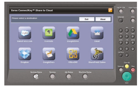
Ondersteunt populaire opslagplaatsen in de cloud.