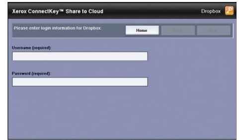
Meld u op het multifunctionele systeem rechtstreeks en veilig aan bij de cloudopslagplaats van uw voorkeur.