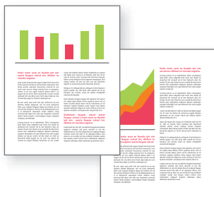
MS Outlook 2 fargesider