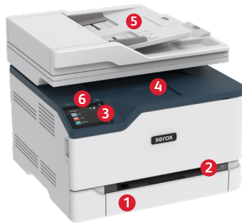
Impressoras multifuncionais a cores Xerox® C235