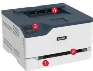
Xerox® C230 -väritulostin