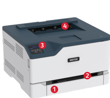
Impresora color Xerox® C230