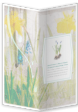
Dobragem em V