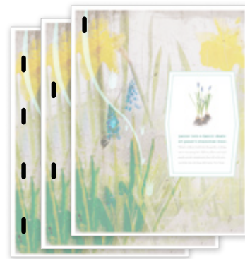
Agrafos em várias posições