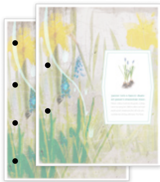
Furação de 2/4 furos