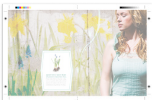
Saída de grandes formatos para produção A3

A impressora a cores Phaser 7800 disponibiliza aos profissionais de artes gráficas um impressionante leque de opções de finalização preparadas para trabalhos profissionais à sua escolha. Dependendo das suas necessidades e do seu orçamento, pode escolher o Finalizador Profissional completo e desfrutar de empilhamento, agrafamento, perfuração, criação de booklets e dobragem em V, ou então começar pelo Finalizador Office LX e desfrutar de empilhamento e agrafamento com a flexibilidade para acrescentar capacidades separadas de furação, dobra, e agrafamento conforme as necessidades do seu volume de trabalho.