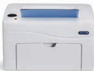
Phaser 6020. Tisk.