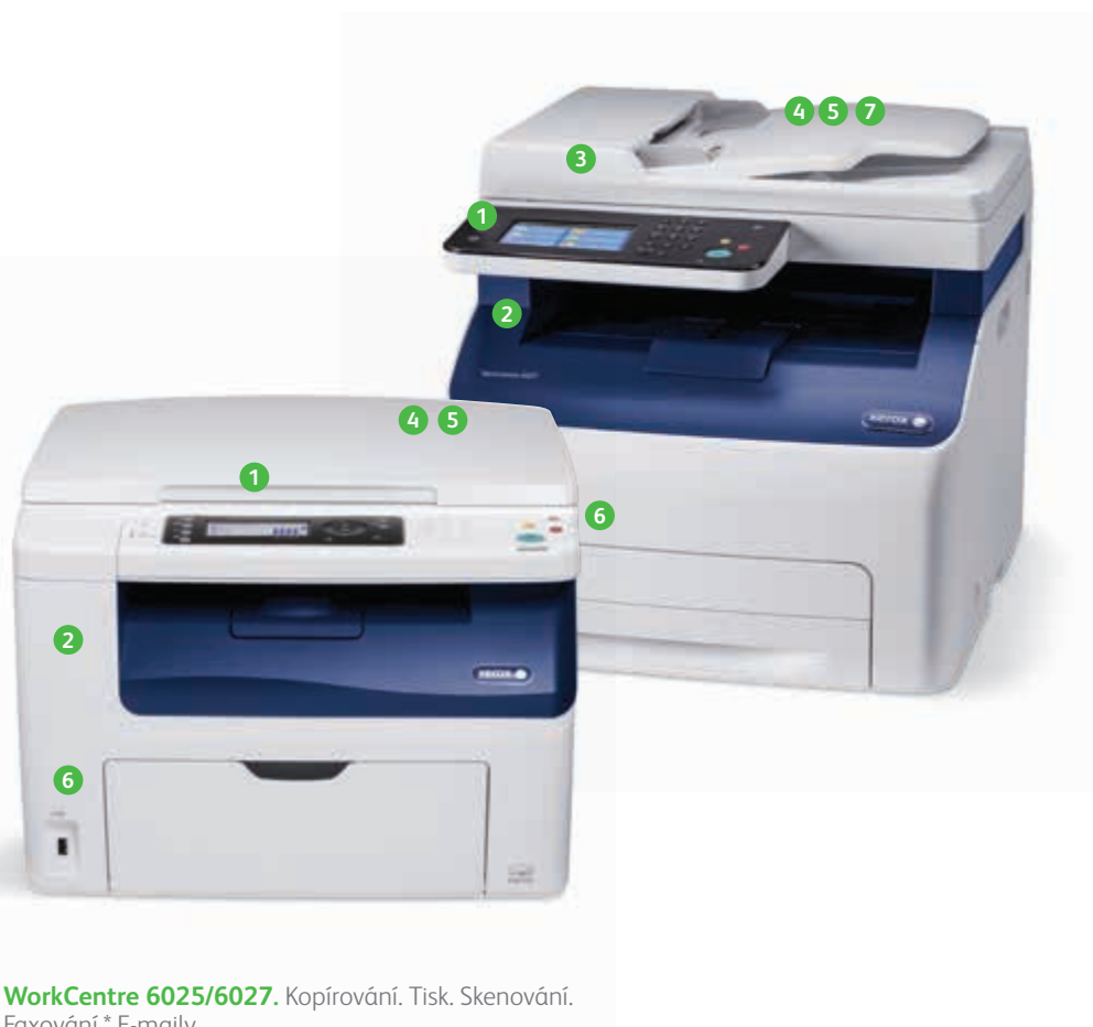
WorkCentre 6025/6027. Kopírování. Tisk. Skenování. Faxování.* E-mailly.

* Dostupné pouze u tiskárny WorkCentre 6027.