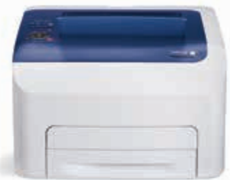
Phaser 6022. Tisk.