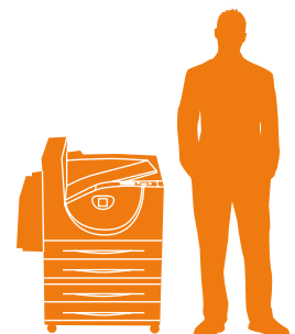
Phaser 5550 DT με τροφοδότη 1.000 φύλλων

5550B, N, DN: 640 x 525 x 498 mm 5550DT: 640 x 525 x 778 mm