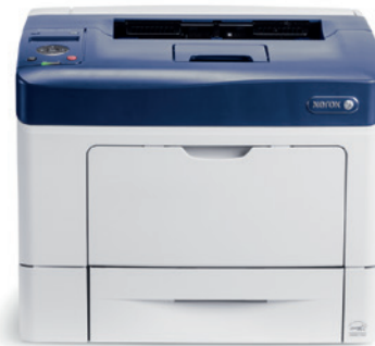
Phaser 3610. Skriv ut.