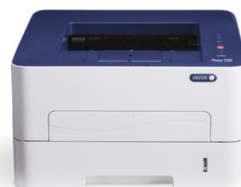
Phaser 3260. Utskrift.