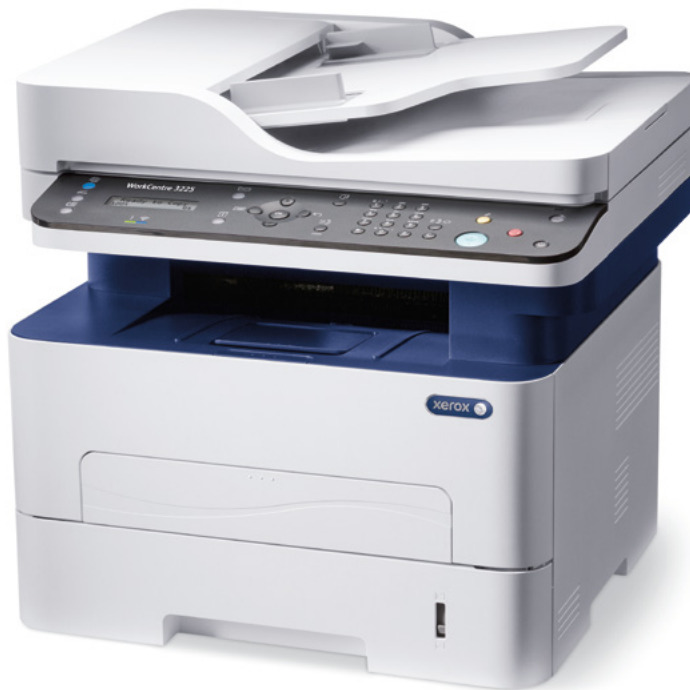
WorkCentre 3225. Kopioi. Tulosta. Skannaa. Faksaa. Lähetä sähköpostia.