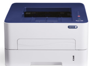
Phaser 3260. Tulosta.