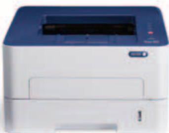
Phaser 3052. הדפסה.