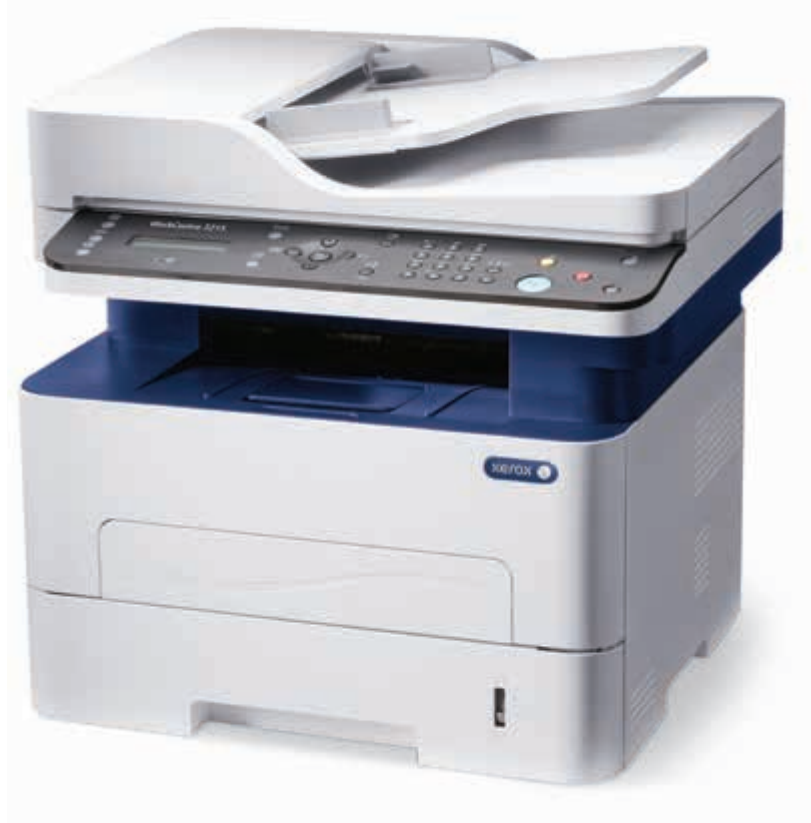
WorkCentre 3215: Kopyalama. Yazdırma. Tarama. Faks. E-posta.