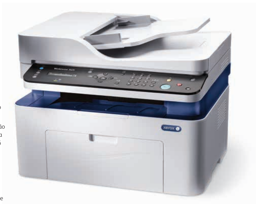
WorkCentre 3025. Cópia. Impressão. Digitalização. Fax.*

* Fax e ADF disponível somente na WorkCentre 3025NL.