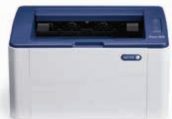
Phaser 3020. Nyomtató.