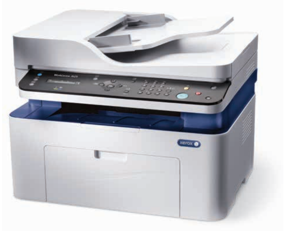
WorkCentre 3025. Kopyalama. Yazdırma. Tarama. Faks.*

* Faks ve ADF yalnızca WorkCentre 3025NI'da kullanılabilir.