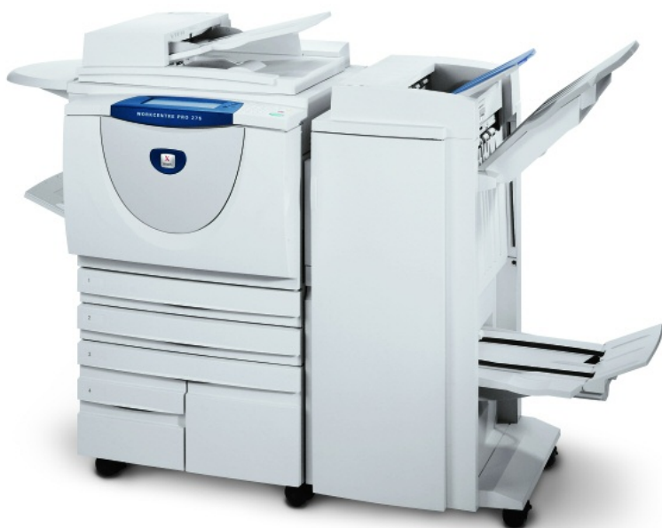
WorkCentre Pro 275 apresentado com o Finalizador Profissional

Perfeita para grupos de trabalho em grandes escritórios e ambientes de pequena produção, que necessitam de um sistema multi-funcional