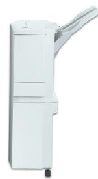
Finalizador Office Agrupamento em várias posições