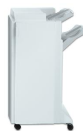
Finalizador Advanced Office agrafar em várias posições, furar