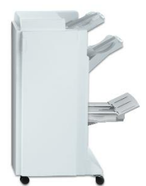
Finalizador Profissional agrafar em várias posições, furar, booklets com agrafos no vinco, dobrar em V