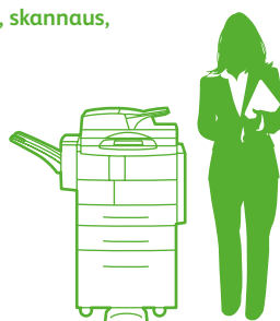
WorkCentre 4260XF, jossa viimeistelylaite ja 2 000 arkin paperinsyöttölaite