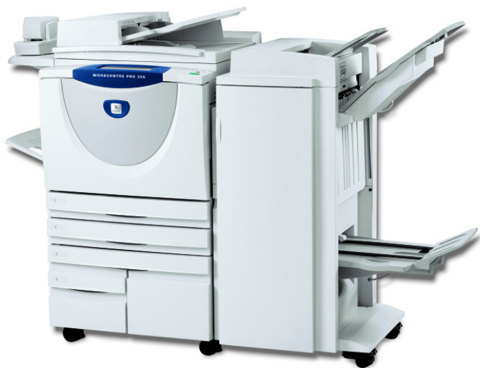
WorkCentre Pro 255 ilustrado com Finalizador profissional e agrafador

Exceda todas as necessidades de tratamento de documentos do seu grupo de trabalho de pequena a média dimensão, utilizando um único equipamento versátil.