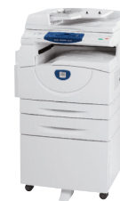
WorkCentre 5020 vist med automatisk tosidig dokumentmater, valgfri skuff 2 og bord/skap

UL – 60950 – 1 / CSA – 60950 – 1 – 03, CE Mark passende til Directives 2006 / 95 / EC, 2004 / 108 / EC, 1999 / 5 / EC