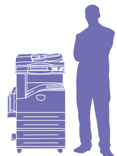
WorkCentre 5230 com módulo de duas bandejas