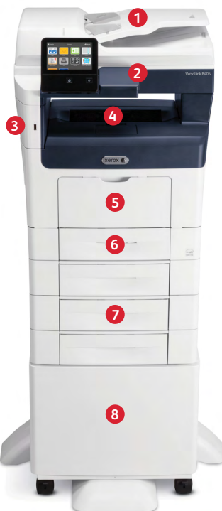
Xerox® VersaLink® B405 multifunksjonsskriver Utskrift. Kopiering. Skanning. Faksing. E-post.