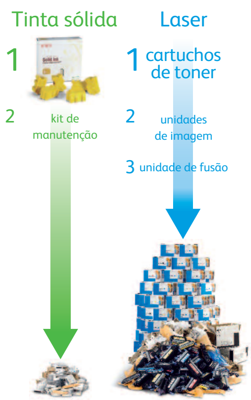
Resíduos de 1 impressora