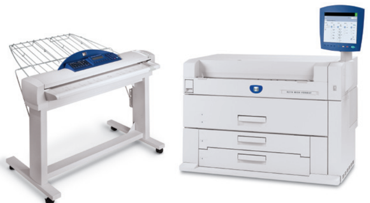
Multifunktion med system til scanning af bredformat