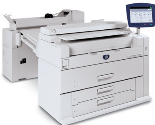
Kopimaskine/printer med online 3-falsning