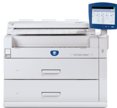
Kopimaskine/printer med indbygget scanner