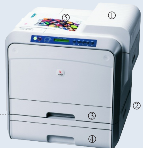
Phaser 6100DN mit optionalem 500-Blatt-Papierfach