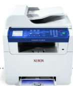
impressão | cópia | digitalização