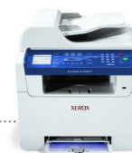
impressão | cópia | digitalização | fax