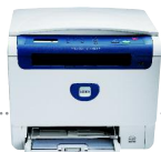
impressão | cópia | digitalização