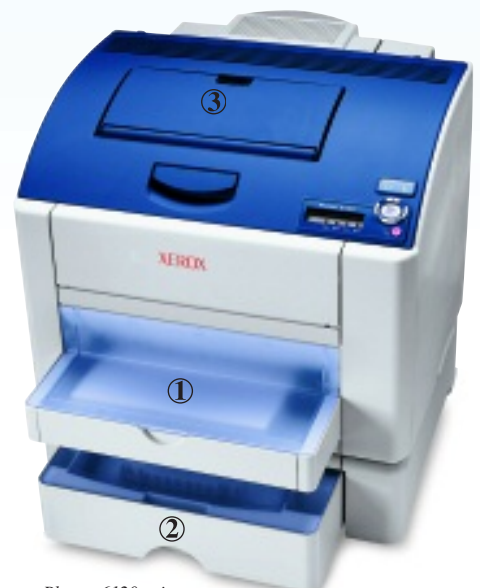
Phaser 6120 printer vist med ekstra 500-arks fremfører

Ekstra harddiskdrev giver avancerede funktioner, såsom gemt print og sikker print, plus problemfri sortering af flere sæt opgaver.