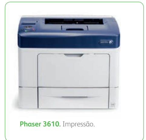
Phaser 3610. Impressão.