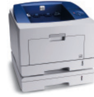
Phaser 3435 opsiyonel Tepsisi 2 ile görülmüyor