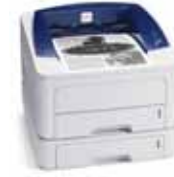
Phaser 3250 opsiyonel Tepsi 2 ile görülüyor