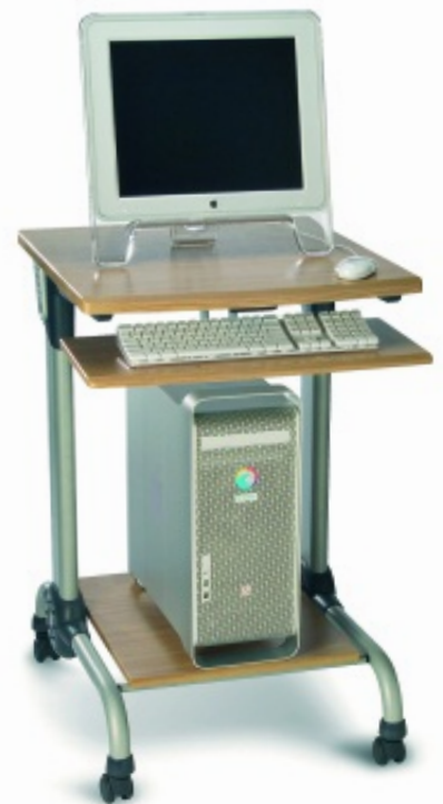
Servidor de color para red EFI Splash G3535 con soporte de servidor opcional.